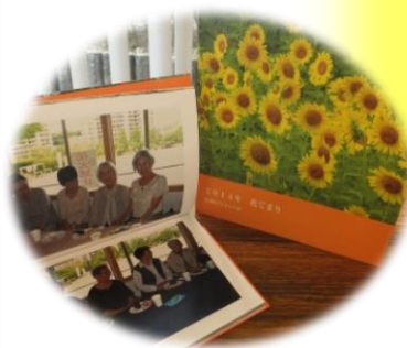
◀ 一年間の思い出アルバム