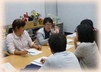
◀ スタッフ間のお話し合い