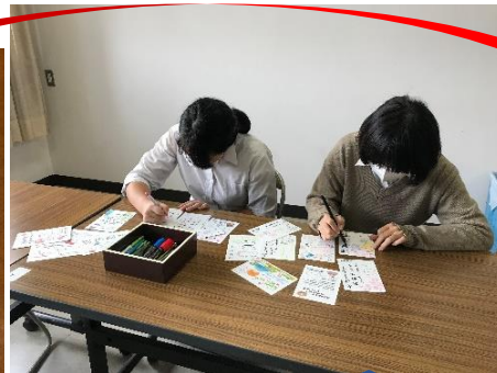
皆さまの気持ちにあたたかい 言葉を添えて届けられます