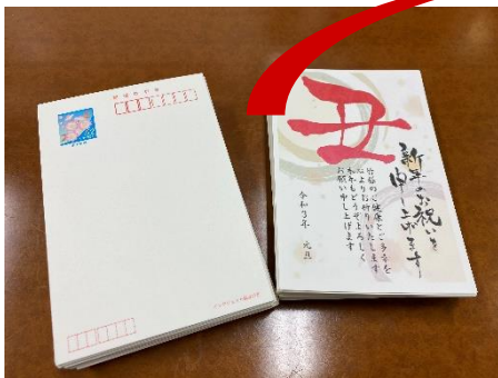
書き損じ・未使用はがき

地域福祉団体が地域の中でつながりを深める事業として、ひとり暮らし高齢者等の気にかかる方へ、小学生や高校生の皆さんが書かれた年賀状を発送されています。