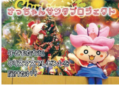
▲クラウドファンディング（インターネット上での募金）では、東京都や北海道など、県外の方からもご協力いただきました。