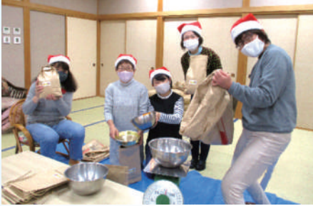
▲「楽しく」、「自分ができること」認知症や障害のある方、学生など、ボランティアさんが活躍されました