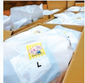
▲新品のタオル・Tシャツ、熱中症対策の飴、応援メッセージを被災地へ！

さっちゃん応援パッケージ 昨年7月の九州豪雨災害でもコロナ禍でボランティア派遣ができない中、三田で皆さまの思いを集め、被災地へ届けました。