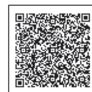
▲さんだつどいの場マップ