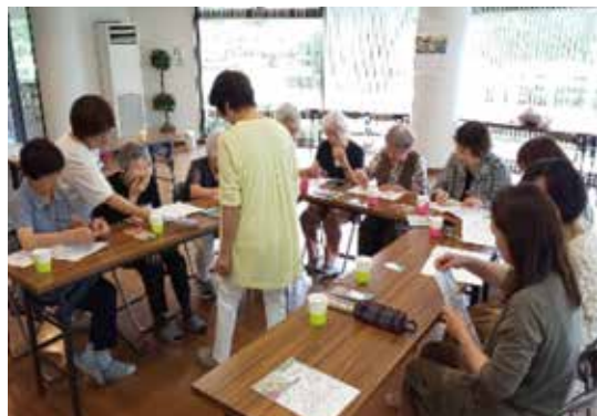
気まま茶屋 花てまり (以前の様子)

「皆さん、最近の様子や色んなお話をしてくださって、久しぶりにお会いできて良かったです」と笑顔でお話をしてくださいました。