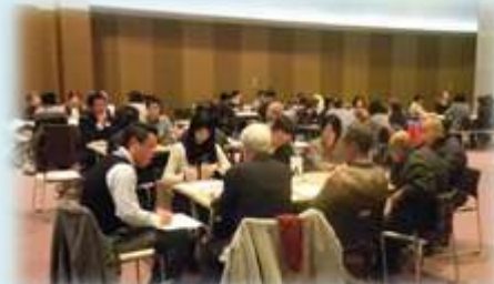
▲H23年度「福祉学習推進研修会」の様子